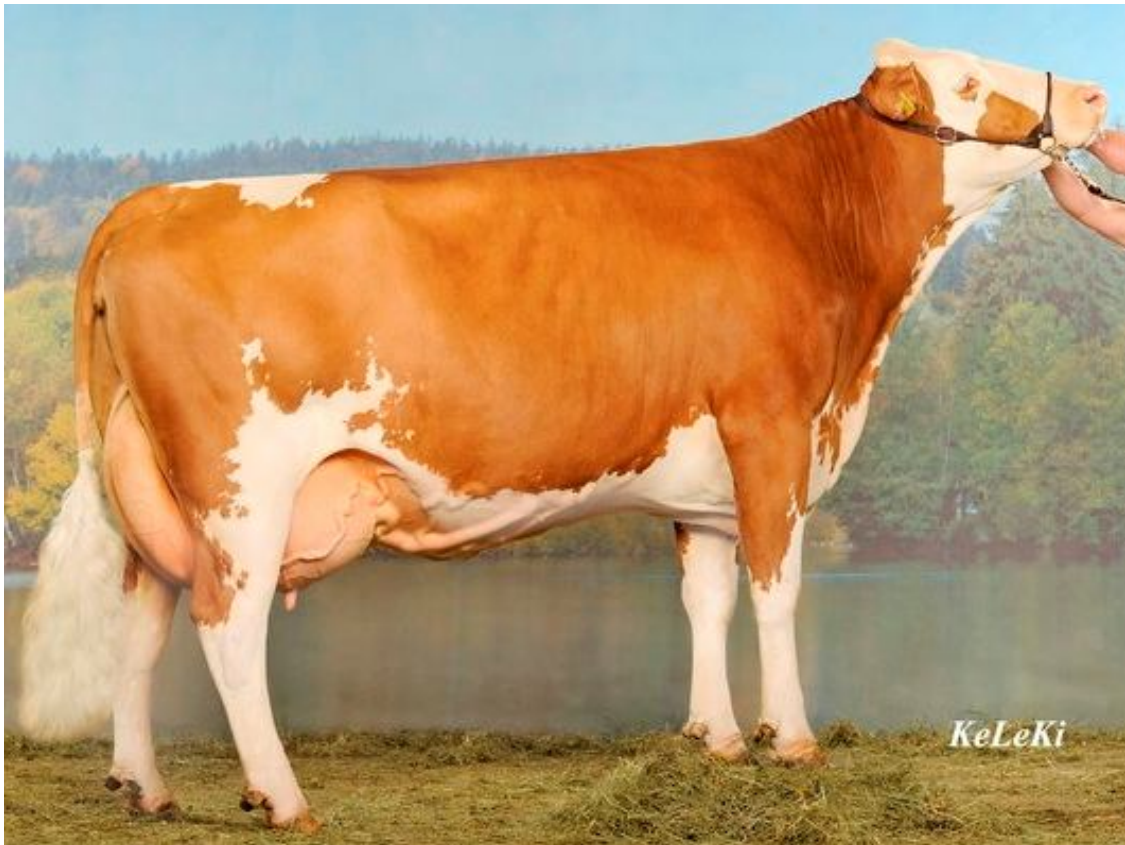
Šampionka: Paris (ZAHNER x WATERBERG) – 2/1 9.807 - 4,11 - 3,84