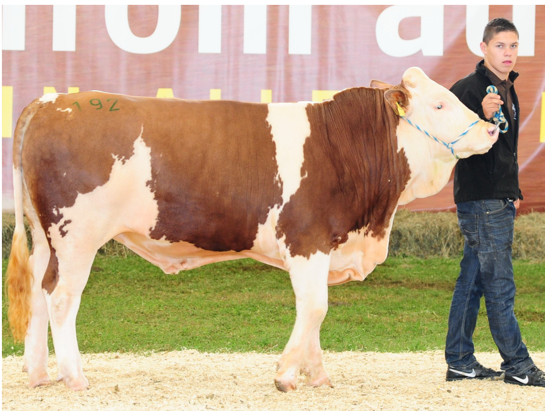
Najskuplji bik aukcije: 14.200 €- Maestro (MALHAXL x GEBALOT) gZW 131