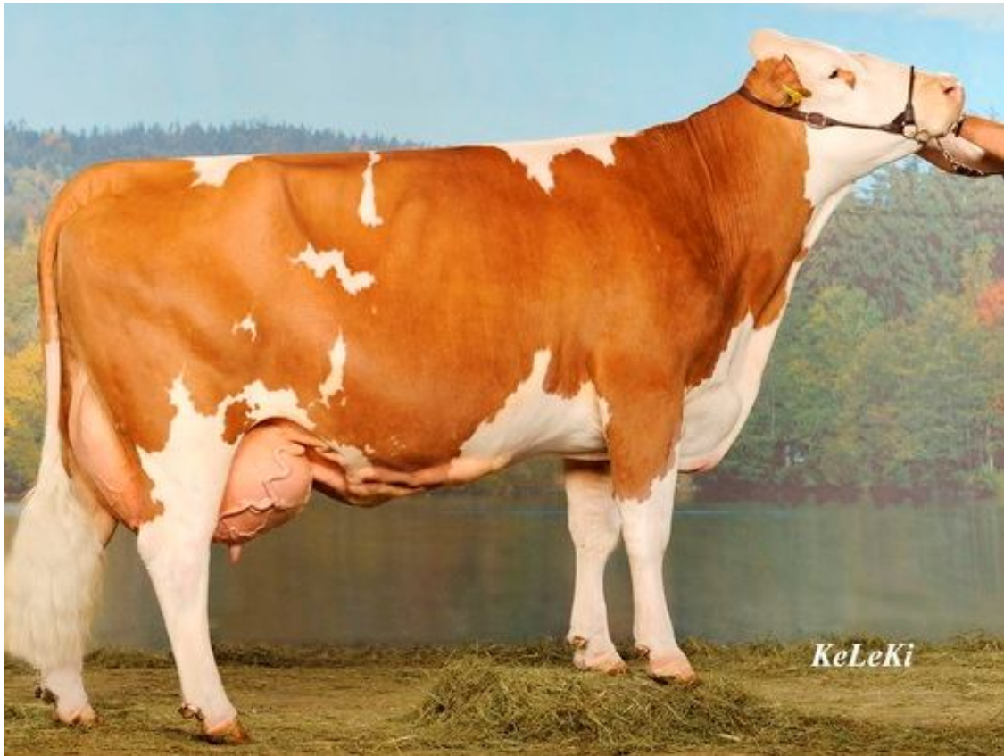
Rez. šampionke: Melli (ROMEL x FLIPPER) – 5/4 10.660 - 3,59 - 3,38