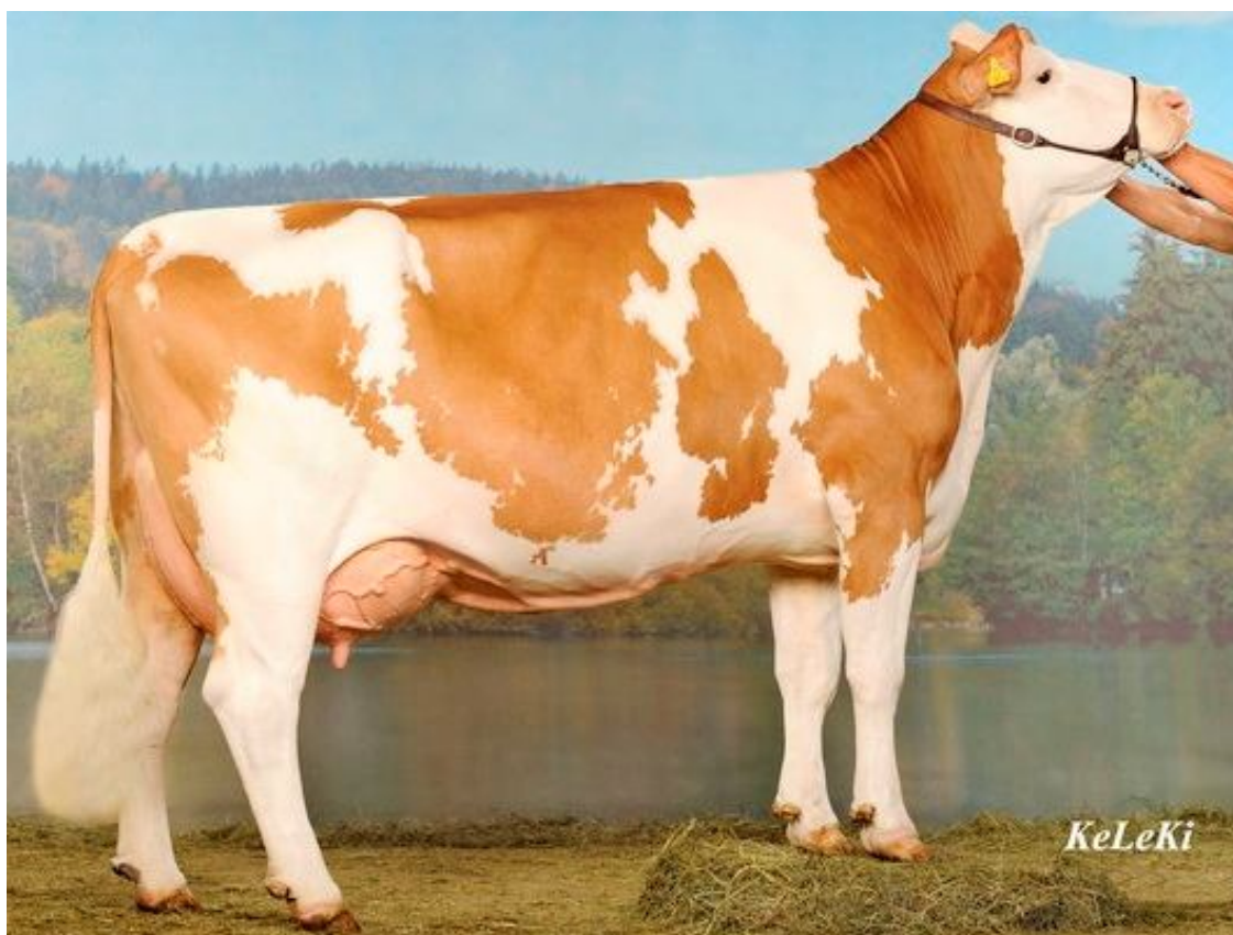
Rez. šampionke: Nelli (WEINOLD x HUMID) – 4/3 9.112 - 4,86 - 3,46

KRAVE SA ŽIVOTNOM PROIZVODNJOM > 50.000 kg